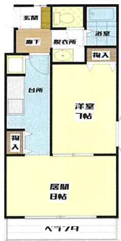
Dタイプ(1・6号室) ※6号室反転